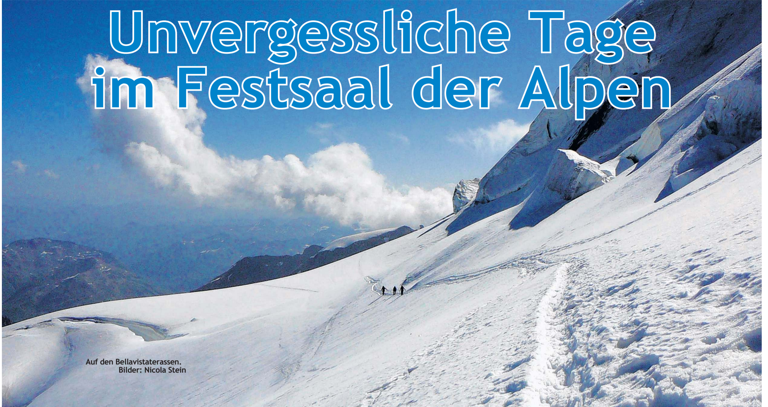
Auf den Bellavistaterrassen.

Der Festsaal der Alpen ist die Berninagruppe im Schweizer Kanton Graubünden - und dieser Name ist berechtigt. Für Bergsteiger ist die Bernina als einziger 4000er der Ostalpen mit dem berühmten Biancograt ein Traumziel. Auch die umgebenden Gipfel mit so klingenden Namen wie Piz Palü, Bellavista oder Piz Morteratsch locken mit anspruchsvollen Hochtouren.