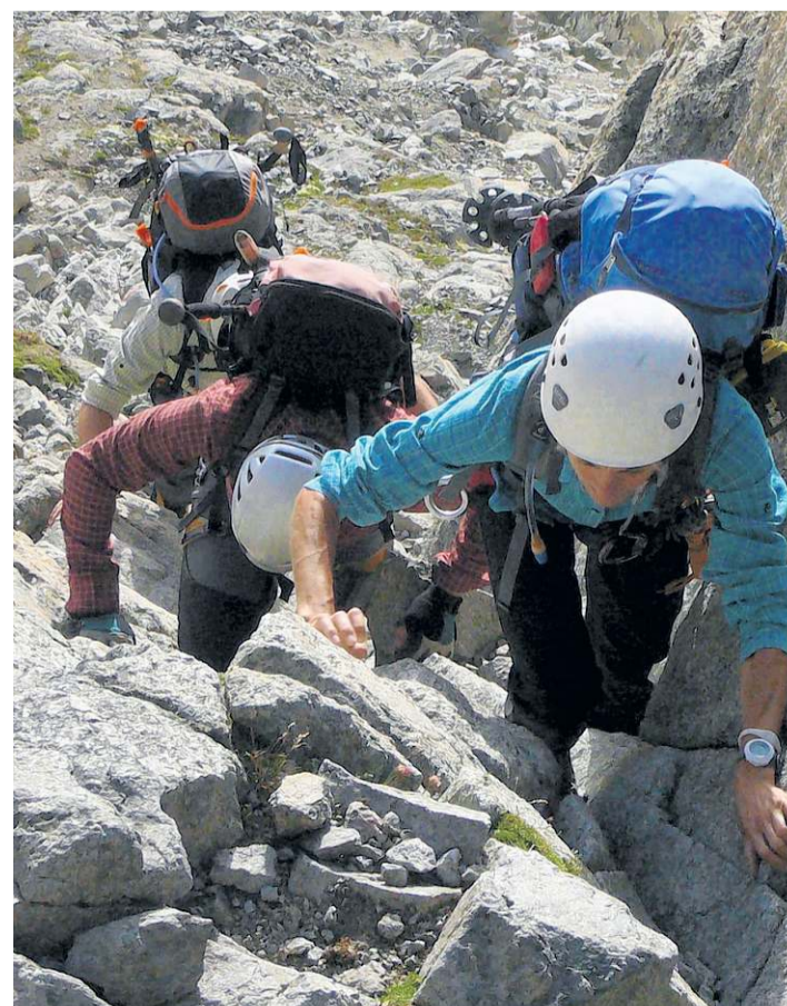
Leichte Kletterei an der Fuorcla da Boval.