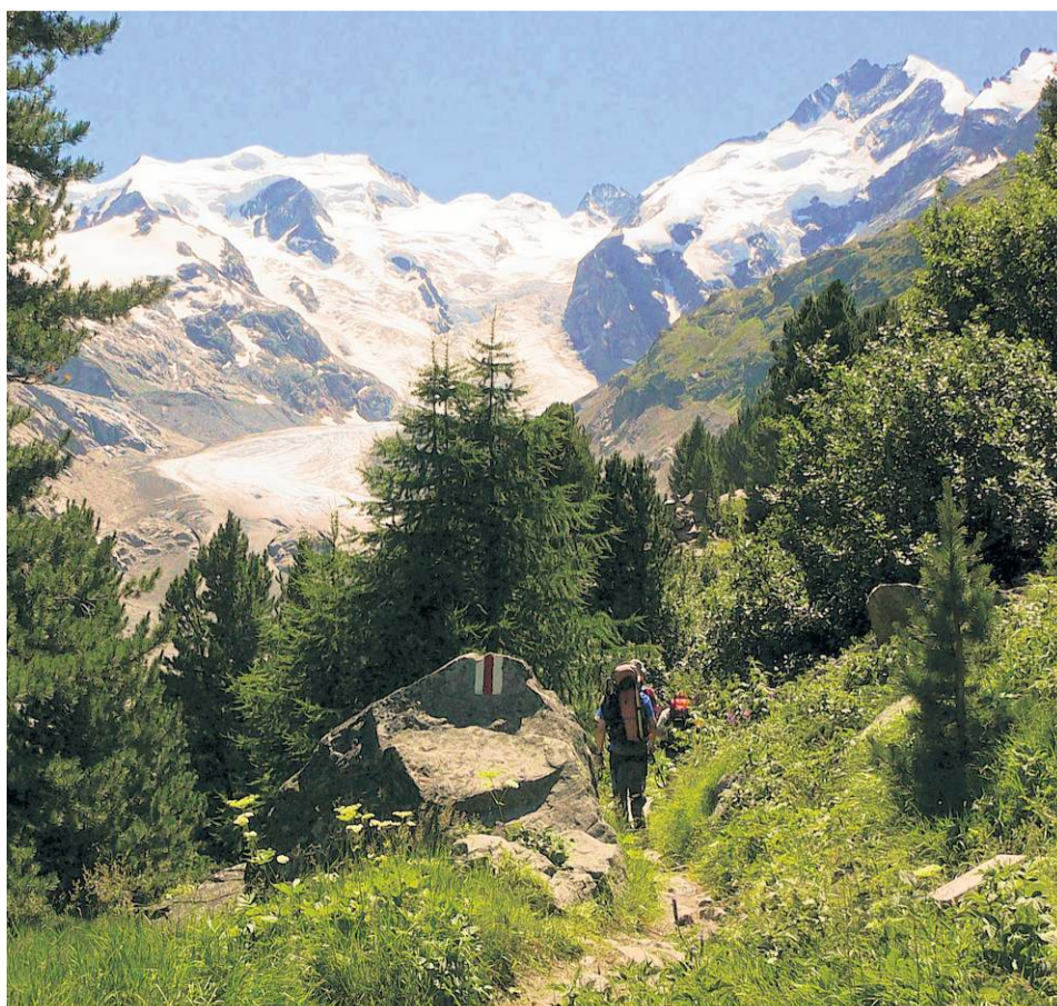
Aussichtsreiche Wanderung zur Bovalhütte.

Mehr zur Bezirksgruppe Kreis Böblingen der Sektion Schwaben des Deutschen Alpenvereins und zu deren Tourenangebot gibt es unter der Adresse www.alpenverein-bb.de im Internet.